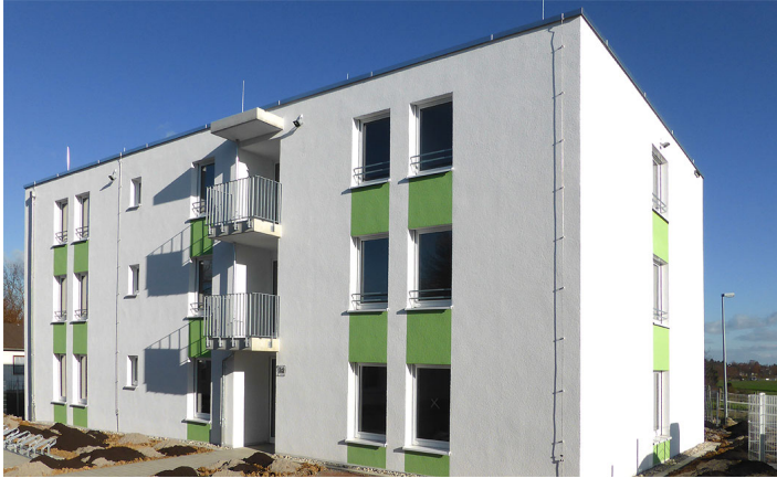
Wohnen am Erlenweg | Ludwigsburg