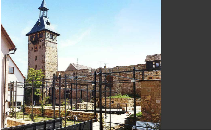
Burgplatz Marbach am Neckar